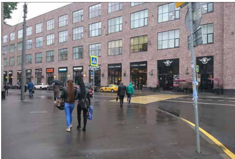
Рис. 3. Москва, улица Ленинская Слобода, метро «Автозаводская»; 6 сентября 2017 года, среда, 10 часов 51 минута.

В силу центрального расположения Автозаводский район превращается в востребованную динамичную и конкурентную территорию, где соседствуют как «новые», так и «старые» стили жизни. Идея района для рабочих в постиндустриальном столичном контексте отчасти превратилась в адаптированное офисное пространство с расширенными возможностями потребления и сохранившимся жилым фондом.