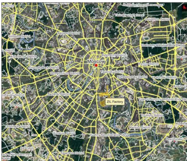
Рис. 1. Расположение территории ЗИЛ в пространстве Москвы.