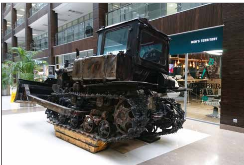
Рис. 5. Москва, ул. Ленинская Слобода, 19, бизнес-центр OMEGAPLAZA, здание бывшего завода. Напротив мужской парикмахерской (barbershop) установлен в качестве арт-объекта трактор; 12 октября 2017 года, четверг, 14 часов.

Таким образом, новые конструируемые пространства стирают из городской памяти значение завода и рабочих. Некогда индустриальные территории активно обживаются новыми жителями, но их коллективная идентичность создается без привязки к району и его локальным сообществам. Упоминание о рабочих происходит преимущественно в контексте арт-объектов, выполненных в жанре китч (см. рис. 5).