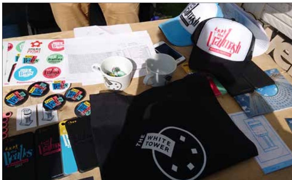
Рис. 6. Екатеринбург, сувенирная лавка на The Beatles Fest, район Уралмаш, бульвар Культуры; 27 мая 2017 года, суббота.

Одна из акций городских активистов, которые хотели облагородить среду обитания жителей одного аварийного дома с помощью раскрашивания стен, также оказалась непонятой его жильцами. Участвовавшие районные музыкальные фестивали (такие как The Beatles Fest) вызывают возмущение некоторых жителей, проживающих в соседних с местом проведения фестиваля домах. По их словам, на время массовых мероприятий их жилые зоны становятся шумными и грязными. В целом подобные акции «окультуривания» Уралмаша воспринимаются коренными жителями неоднозначно. Они традиционно предпочитают посещать мероприятия «старого» и «нового» ДК, иногда заходят в музей Уралмашзавода. Из новых культурных инициатив они принимают участие в интерактивной автобусной экскурсии по району Уралмаш «Автобус-33», во время которой рассказывается про советское и постсоветское прошлое района.