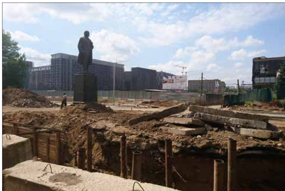
Рис. 4. Москва, территория строящегося арт-квартала «ЗИЛАРТ», где ранее располагались здания и центральная аллея ЗИЛа; 27 июля 2017 года, четверг.

Застройщики и девелоперы – важные агенты на территориях, прилегающих к ЗИЛу и Уралмашу. Они и являются теми, кто инициирует обновления территорий в наши дни: разрабатывают совместно с администрацией города концепцию развития, организуют отделку фасадов бывших заводских зданий, выделяют помещения под аренду. Они реализуют постройку новых жилых и нежилых зданий. Например, на территории ЗИЛа, где несколько лет назад были разрушены цеха и помещения, построены и работают такие спортивные учреждения, как Ледовый дворец ВТБ, Музей хоккейной славы, кафе «Все хоккей» и другие. Снос зданий ЗИЛа, изменения территории до неузнаваемости травматично воспринимаются рабочими. Особое непонимание и обиду вызвали у рабочих завода известия о том, что помещение музея завода было передано Музею хоккейной славы, а нового музея у завода так и не появилось.