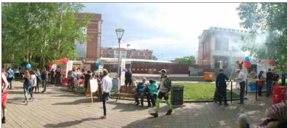
Рис. 8. Екатеринбург, The Beatles Fest, район Уралмаш, бульвар Культуры; 27 мая 2017 года, суббота.