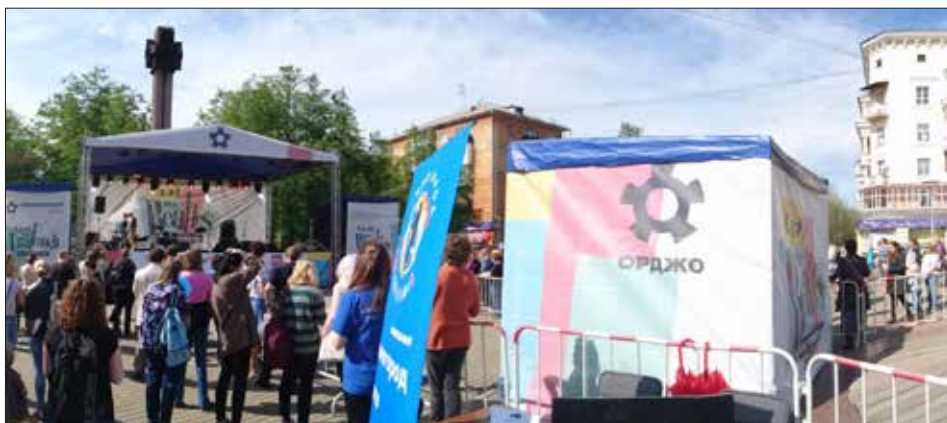
Рис. 7. Екатеринбург, The Beatles Fest, район Уралмаш, бульвар Культуры; 27 мая 2017 года, суббота.

Мне кажется, идентичность, про вовлеченность и приобщенность. [...] помимо «Beatles-фестиваля», дотащить 10 000 велосипедистов и параллельно провести еще и велопрогулку с площади Эльмаша на площадь Уралмаша через 70 км – это тоже событие, которое стало районным. И можно приехать на Уралмаш и на велосипеде покататься. Тут чисто, тут вообще не страшно, тут нет гопников. Кстати, скажу, что на прошлом «Beatles-фестивале» было гораздо больше пьяных, чем на этом (глава района Орджоникидзевский, в который по административно-территориальному делению входит микрорайон Уралмаш, мужчина, возраст не известен, Екатеринбург).