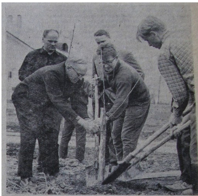
Рис. 1. Сотрудники Обнинского филиала Института прикладной геофизики на субботнике