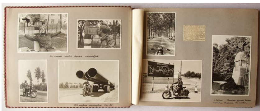
Рис. 7. Альбом 1960 года. Часть 1. Брест – Луцк – Кременец – Почаев – Львов (отпуск с К. Ивановым).

Мототурист волен избирать свой путь, но вынужден соотносить его с ритмом и ограничениями дороги – она препятствует энтропии, создавая «тоннель» внимания и размечая путь километровыми столбами. Еще в первый свой мотопробег Владимир Александрович и его друзья ввели традицию отсчета километров от Красной площади (Aleksejenko 1962:23). В то же время дорога обладает важным для туриста свойством: она меняется с опытом водителя, позволяя ему избежать однообразия: «Почему мы раньше думали, что дважды ехать по одной и той же дороге скучно?» (Дар и Ельянов 1962:171) (рис. 7).