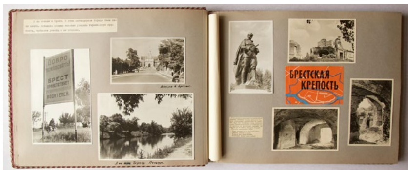
Рис. 8. Альбом 1960 года. Часть 1. Брест – Луцк – Кременец – Почаев – Львов (отпуск с К. Ивановым).

По ту сторону видеоискателя Владимир Александрович выступал вместе с мотоциклом – главным героем хроники. При этом мототурист обычно избегал типичных для любительской фотографии поз (Бойцова 2013:108–121), принимая подчеркнута расслабленное положение, пребывая в состоянии действия. Нередко роль позирующего туриста исполнял мотоцикл, иногда съемка велась от его «лица» (рис. 8). В ассамбляже мотопутешествия фотография – это медиум, визуализирующий гибрид человека и машины. Результатом затейливой постановки одного кадра стал киборг, запечатленный у заброшенной часовни Ивана Грозного в Переславле-Залесском (рис. 9): на переднем плане в раму (вероятно, оклад иконы) помещена «Ява», тогда как Владимир Александрович находится в отдалении и смотрит в объектив. Будто в отражении водитель и мотоцикл образуют двойной портрет, а снимок вовлекает зрителя в визуальную игру с позицией наблюдателя, подобную той, что стала предметом интереса Мишеля Фуко ([1966] 1994) и Светланы Алперс ([1984] 2022) в анализе картины Диего Веласкеса «Менины» 37 . Оптическую двусмысленность симбиоза подмечали и сами мототуристы: «Можно увидеть в зеркале [мотоцикла] свое лицо. Только свое ли?» (Дар и Ельянов 1962:72).