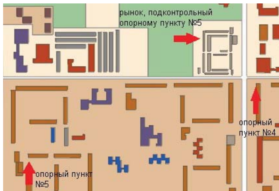
Рис. 3. Схема расположения опорных пунктов в микрорайонах N4 и N5